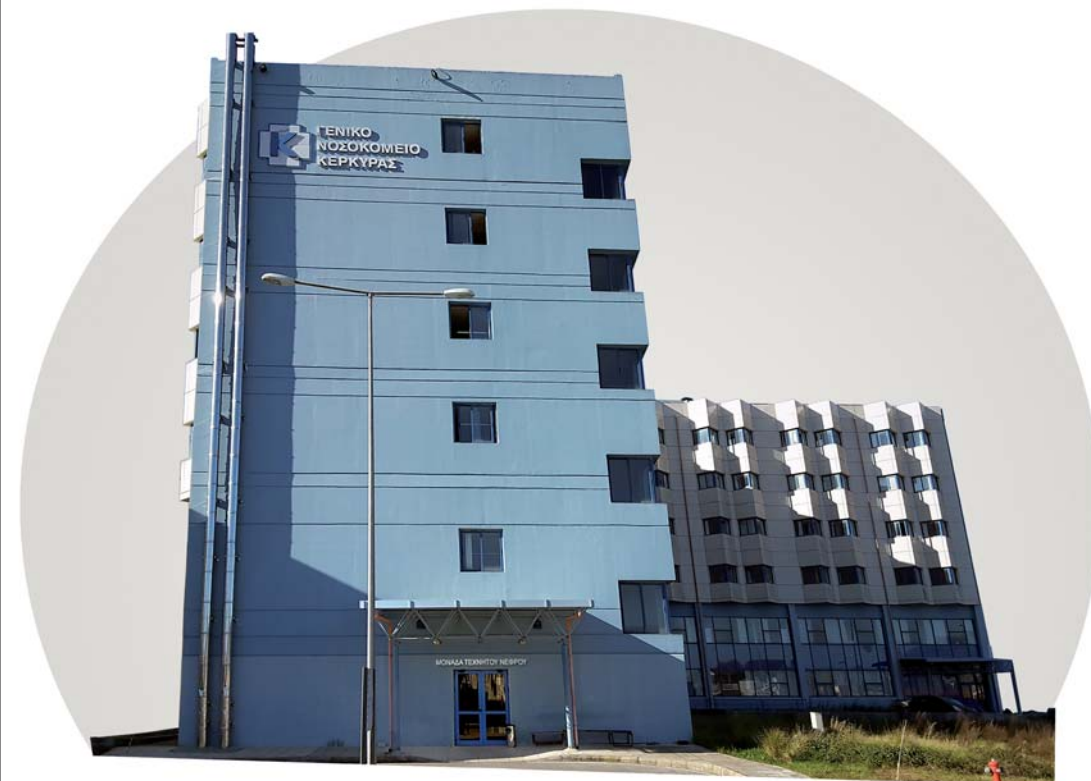
ΓΕΝΙΚΟ ΝΟΣΟΚΟΜΕΙΟ ΚΕΡΚΥΡΑΣ

Τ.Ε.Π. - Χειρουργικό Τμήμα: 266 1360.782